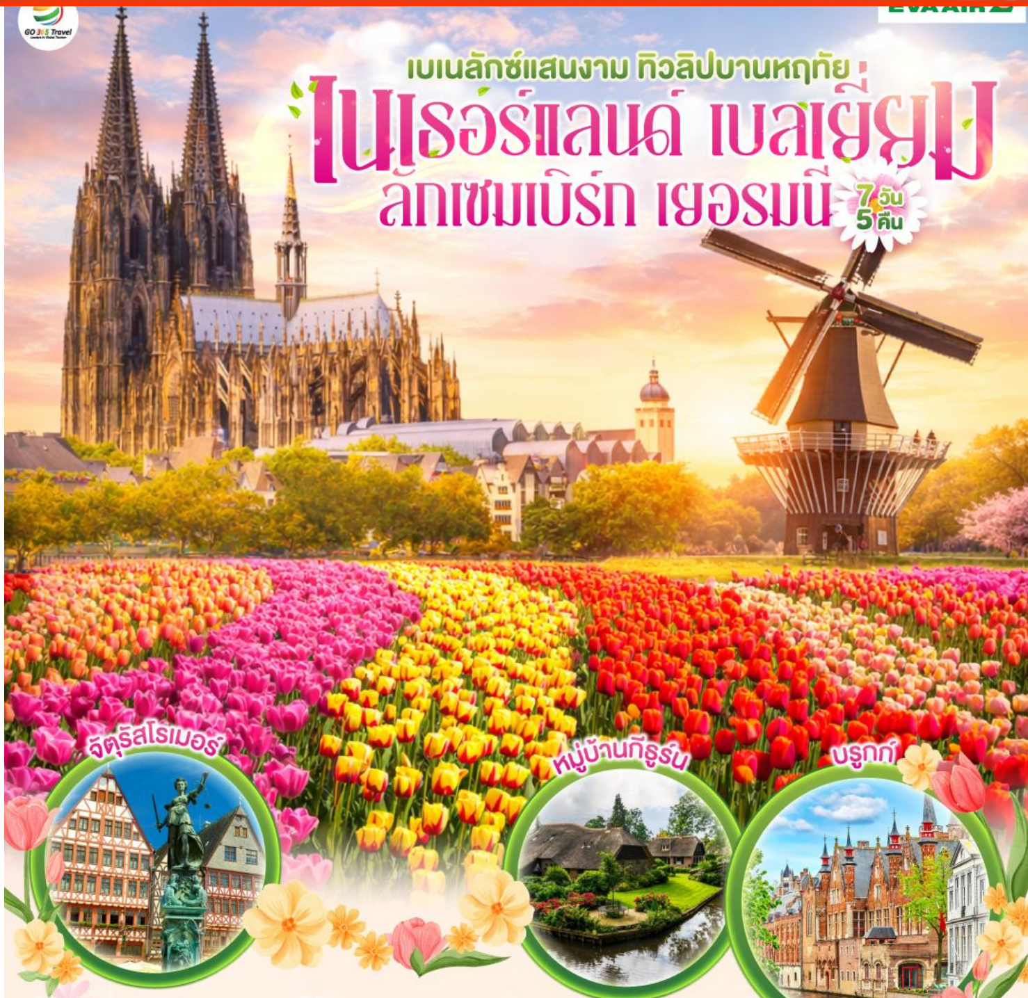
จตุรัสโรเมอร์