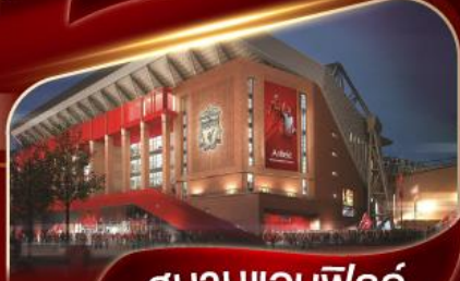
สนามแอนฟิลด์