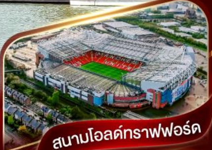
สนามโอลด์แทรฟฟอร์ด