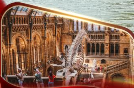
พิพิธภัณฑ์ประวัติศาสตร์ธรรมชาติ ลอนดอน