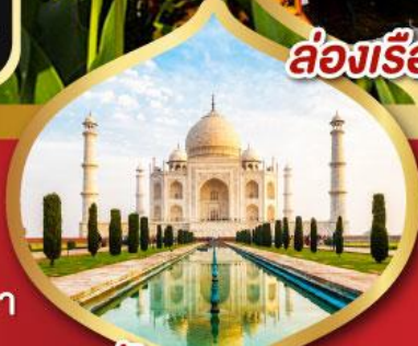
ทัชมาฮาล