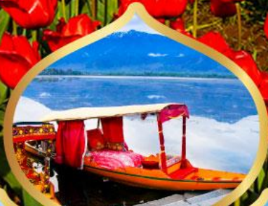
ล่องเรือชิคาร่า