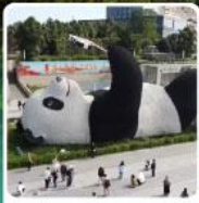
รูปปั้นหมีแพนด้าเซลฟ์

แวะชิมปังย่างเผม่าล่า ร้านคุณพ่อ (ตั้งแอดตี้) ที่เมืองเล่อซาน เดินทาง