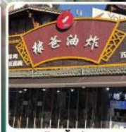
ร้านปังย่างของพ่อหวังเหอตี้