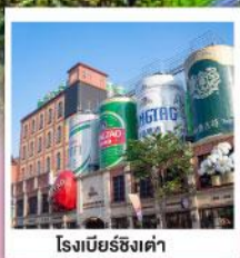
โรงแรมชิงเต่า