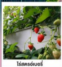
โรสครอว์เบอร์รี่