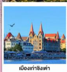
เมืองท่าชิงเต่า

ละมุนกรุ่นกลิ่นสตรอว์เบอร์รี่ เบียงนไฉ เว่งไห่ จี้หนาน