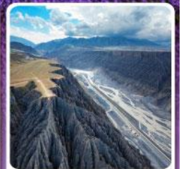
แกรนด์แคนยอนคู่ซานจื่อ