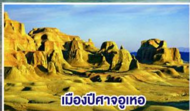
เมืองปีศาจจู่ทอ