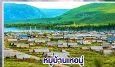
หมู่บ้านเหมย