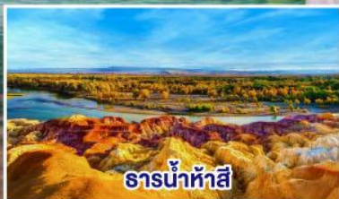
ธารน้ำห้าสี