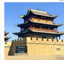
กำแพงเจียยี่กวน