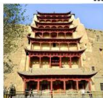
ถ้ำม่อเกา