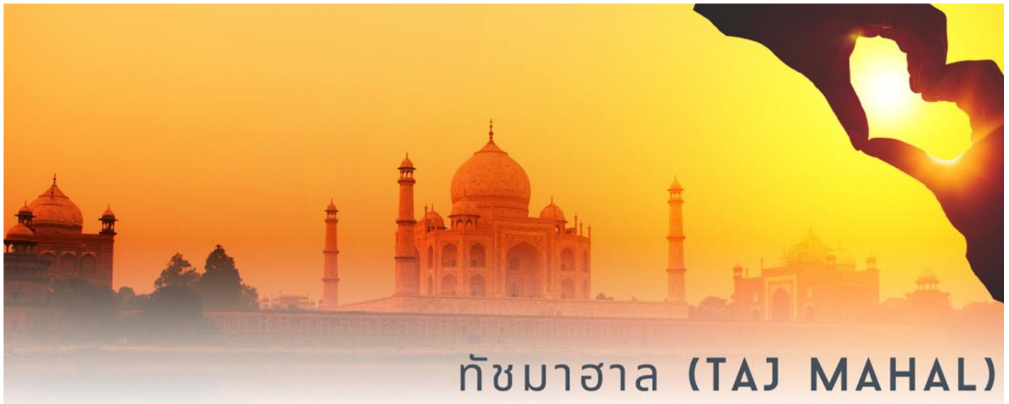
ทัชมาฮาล (TAJ MAHAL)

นำท่านเดินทางชมความงดงามของสถาปัตยกรรม 1 ใน 7 สิ่งมหัศจรรย์ของโลก ทัชมาฮาล (Taj Mahal) ชมอนุสรณ์สถานด้านใน ที่แสดงให้ความรักที่ยิ่งใหญ่และนิจนิรันดร์ของกษัตริย์ชา จารฮาลมีต่อพระมเหสี มุมตซ์ มาฮาล ซึ่งสวรรณคตเนื่องจากการให้กำเนิดบุตรคนที่ 14 สถานที่ แห่งนี้ใช้สำหรับเป็นที่ฝังพระศพของพระนางมุมตซ์ และกษัตริย์ชาจารฮาล ตั้งสง่าอยู่ริมแม่น้ำ ยมุนา 1 ใน 5 แม่น้ำสายหลักของชาวอินเดีย สร้างขึ้นด้วยหินอ่อนสีขาวและหินทรายสี ได้รับการจด ทะเบียนให้เป็นมรดกโลกทางวัฒนธรรม เมื่อปีพุทธศักราชที่ 2526 หรือปีคริสต์ศักราช 1983