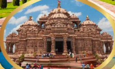
วิหารอักซาร์ดีม