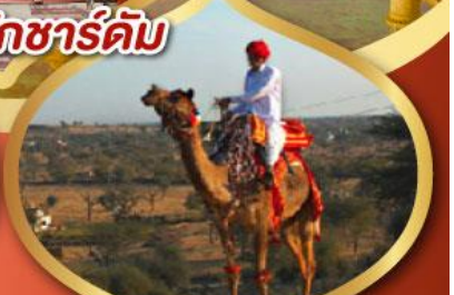
ฟรี จักรู เมืองมันทอวา ราคาเริ่มต้น