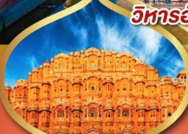
พระราชวัง สายลม