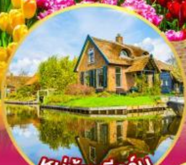
หมู่บ้านที่รูรัน