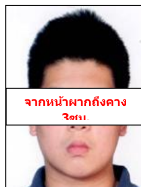
จากหน้าผากถึงคาง 3 ซม.