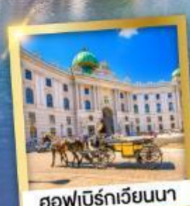
ฮอฟบวร์กเวียนนา