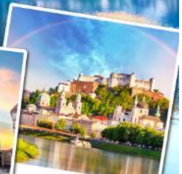
ชาลส์บวร์ก