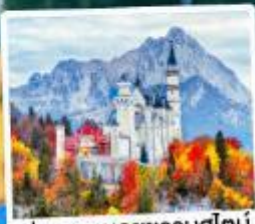
ปราสาทน้อยชวานสไตน์

09-15, 12-18 เม.ย. 69 26 เม.ย.-02 พ.ค. 69 29 เม.ย.-05 พ.ค. / 30 เม.ย.-06 พ.ค. 69 02-08 พ.ค. / 24-30 มี.ย. 69 02-08, 16-22 ก.ย. 69