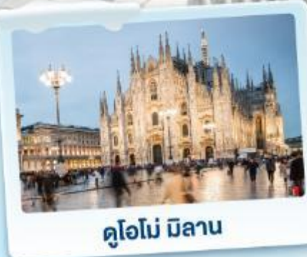
ดูโอโม มิลาน