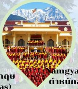
Amgyal Monastery ตำหนักองค์ดาไลลามะ ตารัมซาล่า