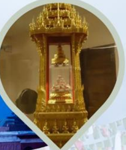
สักการะพระบรมสารีริกธาตุ พิพิธภัณฑ์สถานแห่งชาติ กรุงนิวเดลี