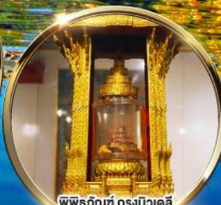
พิพิธภัณฑ์ กรุงนิวเดลี กราบมัสการพระบรมสารีริกธาตุ