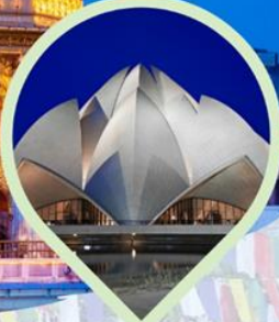
Lotus Temple หอดอกบัว ของ ศาสนาบาไฮ กรุงเดลี