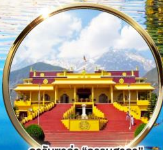
ดาริมซาล่า "ธรรมศาลา" ตำหนักองค์ดาไลลามะ