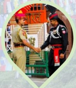
พิธีลดธง พรหมแดน อินเดีย-ปากีสถาน ชายแดนวากา (Wagah border)