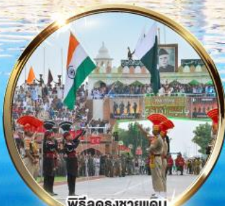
พิธีลดธงชัยแดน อินเดีย-ปากีสถาน ผ่านวากาห์

บินภายในไป-กลับ DEL ATO IXC DEL นั่งรถไฟไม่เหนื่อย