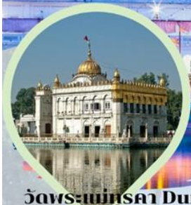
วัดพระแม่ทุสธา Durgayana Temple หรือวัดเงินพระแม่ลักษมี