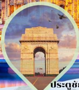
ประตูชัย India Gate สัญลักษณ์แห่งหนึ่ง ของกรุงนิวเดลี