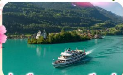
ล่องเรือทะเลสาบเบรียนซ์

พิชิตยอดเขาชุนเนกกา 1 ในเขาที่สวยงามที่สุดเมืองเซอร์แมท