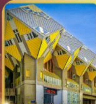
บ้านลูกเต่า โค้ดคูมูส

“ล่องเรือหลังคากระจก” ชมกรุงอัมสเตอร์ดัม