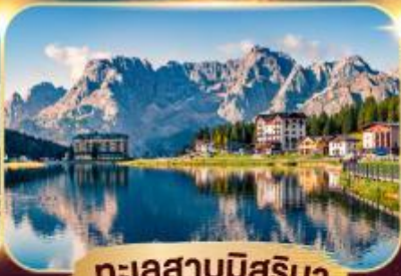
ทะเลสาบมิสุรีนา