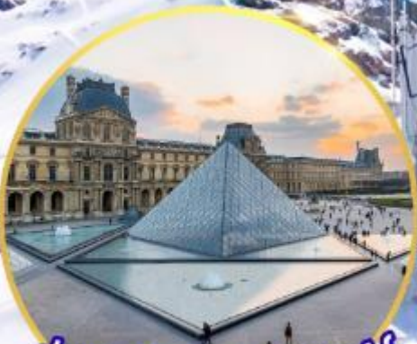
ถ่ายรูปคู่พีระมิดที่ลูฟร์