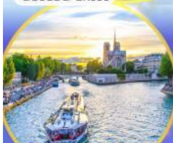
ล่องเรือแม่น้ำเซน