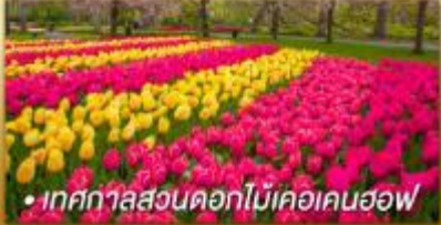
• เทศกาลสวนดอกไม้เคอเคนฮอฟ