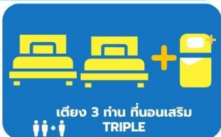
เตียง 3 ท่าน ที่นอนเสริม TRIPLE