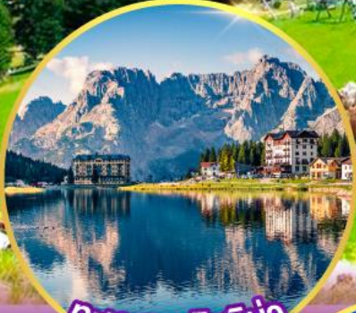
ทะเลสาบมิสุร์น่า