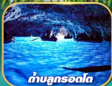
ถ้ำบลูกรอตโต