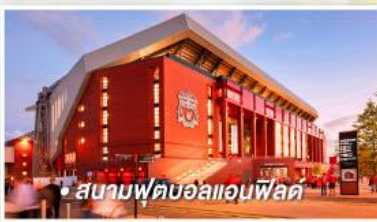
• สนามฟุตบอลแอนฟิลด์