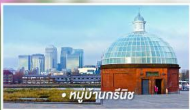
• หมู่บ้านกรีนิช