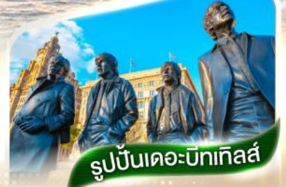
รูปปั้นเดอะบิทเทิลส์

★ ตามรอยวงเดอะบิทเทิลส์และสโมสรรีเวอร์พูล ★ ณ เมืองลิเวอร์พูล