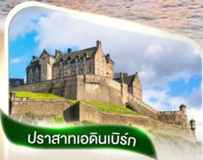
ปราสาทอดินเบิร์น