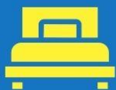
ห้องพักเดี่ยว SINGLE

ตัวอย่างประเภทห้องพัก *เป็นเพียงตัวอย่างเพื่อให้เห็นภาพสำหรับประเภทห้องในแบบต่างๆ