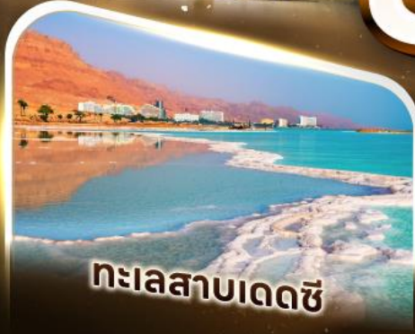
ทะเลสาบเดดซี

เข้าชมพิพิธภัณฑ์แกรนด์อียิปต์ (GEM) พิพิธภัณฑ์ใหม่แกะกล่องพร้อมชม "หน้ากากตุตันคาเมน"