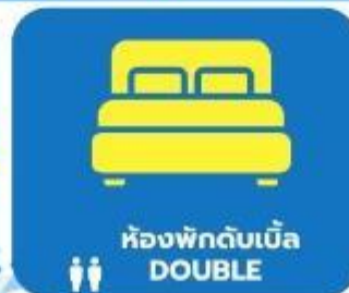
ห้องพักดับเบิล DOUBLE