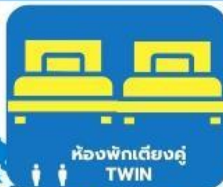
ห้องพักเตียงคู่ TWIN