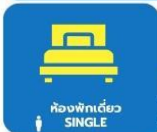
ห้องพักเดี่ยว SINGLE

ตัวอย่างประเภทห้องพัก *เป็นเพียงตัวอย่างเพื่อให้เห็นภาพสำหรับประเภทห้องในแบบต่างๆ