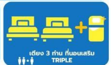
เตียง 3 ท่าน ที่นอนเสริม TRIPLE