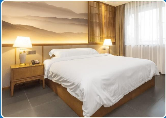
👤 SINGLE (SGL)