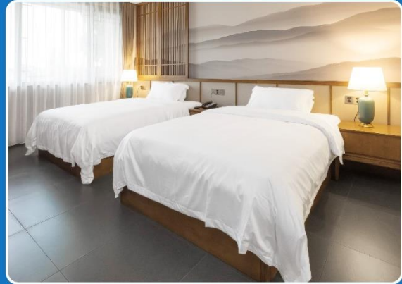
👤👤 TWIN (TWN)