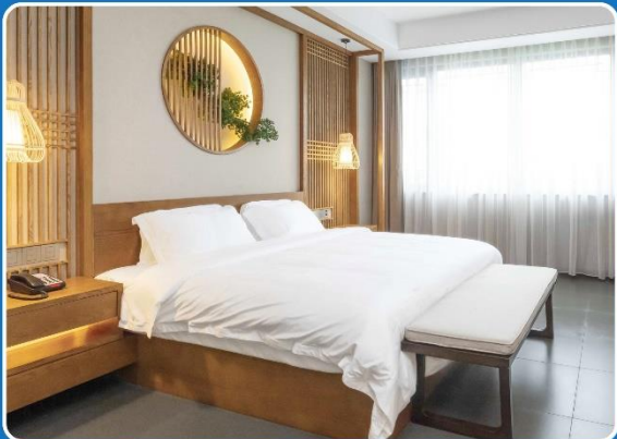
👤👤 DOUBLE (DBL)