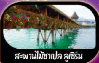
สะพานไม้ชาเปล ลูซิริน