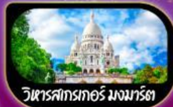
วิหารสกรเทอร์ มงมาร์ต