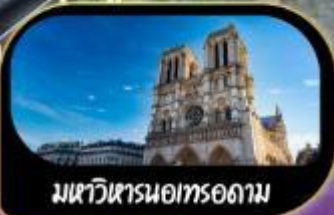
มหาวิหารนอทรอดาม