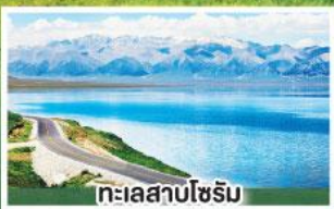
ทะเลสาบไซรัม