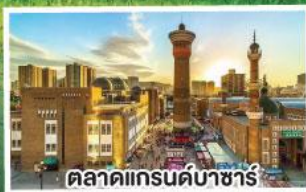
ตลาดแกรนด์บาซาร์