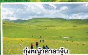
ทุ่งหญ้าคาลาจูน