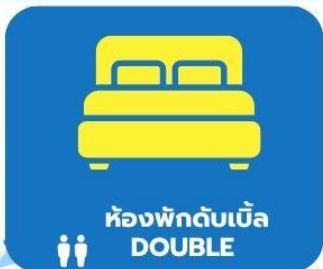
ห้องพักดับเบิล DOUBLE