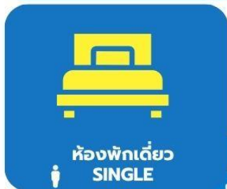
ห้องพักเดี่ยว SINGLE

ตัวอย่างประเภทห้องพัก *เป็นเพียงตัวอย่างเพื่อให้เห็นภาพสำหรับประเภทห้องในแบบต่างๆ