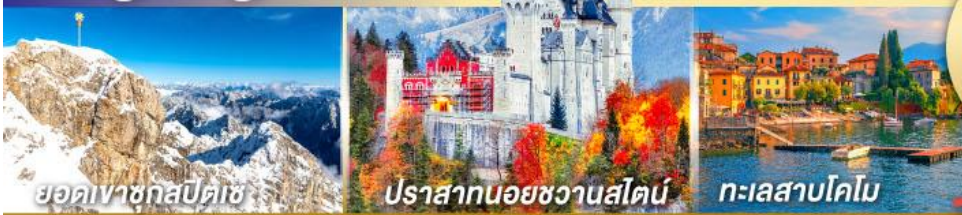
ยอดเขาชุกสปีดเซ