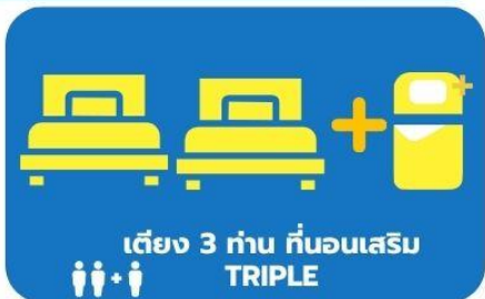
เตียง 3 ท่าน ที่นอนเสริม TRIPLE