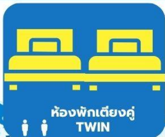
ห้องพักเตียงคู่ TWIN