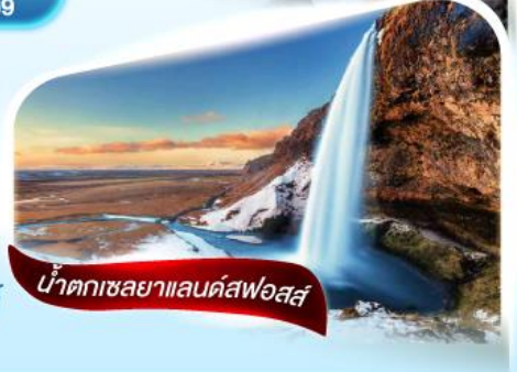
น้ำตกเซลยาแลนด์สฟอสส์