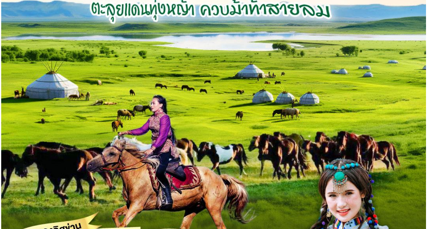
สุสานเจงกิสข่าน