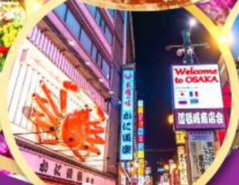
ช้อปปิ้งชินไซ บาชิ