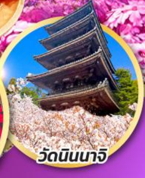
วัดนินนาริ