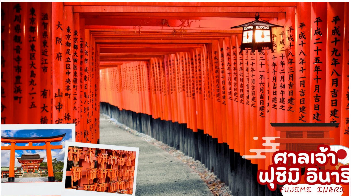
ศาลเจ้าฟูชิมิ อินาริ FUJIMI INARI

ชม ศาลเจ้าฟูชิมิ อินาริ (Fujimi-inari) หรือ ศาลเจ้าจิ้งจอกเป็นศาลเจ้าชินโต (Shinto) ที่มีความสำคัญแห่งหนึ่งของเมืองเกียวโต มีชื่อเสียงโด่งดังจาก ประตูโทริอิ (Torii Gate) หรือเสาประตูสีแดงที่เรียงตัวกันข้างหลังศาลเจ้าจำนวนหลายหมื่นต้นจนเป็นทางเดินได้ทั่วทั้งภูเขาอินาริ (Mt. Inari) ที่ผู้คนเชื่อกันว่าเป็นภูเขาศักดิ์สิทธิ์ โดย เทพอินาริ (หรือ พระแม่โพสพ ตามความเชื่อของไทย) จะเป็นตัวแทนของความอุดมสมบูรณ์ การเก็บเกี่ยวข้าว รวมไปถึงพืชผลไร่นาต่างๆ และมักจะมีจิ้งจอกเป็นสัตว์คู่กาย (บ้างก็ว่าท่านชอบแปลงร่างเป็นจิ้งจอก) จึงสามารถพบเห็นรูปปั้นจิ้งจอกมากมายด้วยเช่นกัน ศาลเจ้าแห่งนี้มีความเก่าแก่มากถูกสร้างขึ้นตั้งแต่ก่อนสร้างเมืองเกียวโตซะอีก คาดกันว่าจะเป็นช่วงประมาณปีค.ศ. 794 หรือกว่าพันปีมาแล้ว อีกทั้งที่แห่งนี้ยังได้เป็นส่วนหนึ่งของภาพยนตร์ฮอลลีวูด เรื่อง MEMOIRS OF GEISHA อีกด้วย