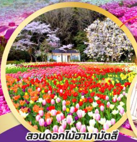
สวนดอกไม้ฮามามัตสึ