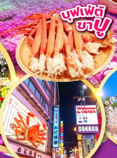
บุฟเฟ่ต์ ชาบู