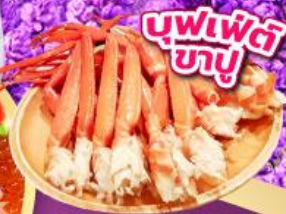
บุฟเฟ่ต์ ขาปู