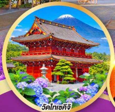
วัดโทเซคิจิ