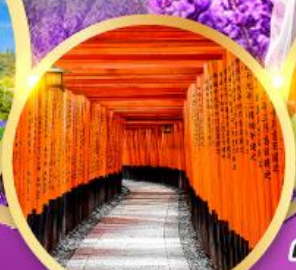
ศาลเจ้าฟุชิมิอินาริ