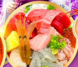
ตลาดปลาซิมิสึ คาชิโมะอิชิ