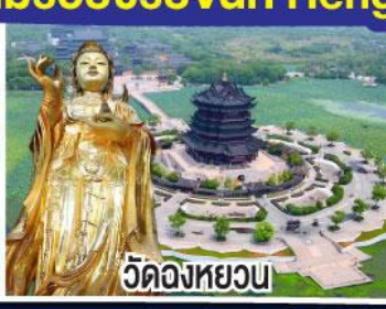
วัดจวงหยวน