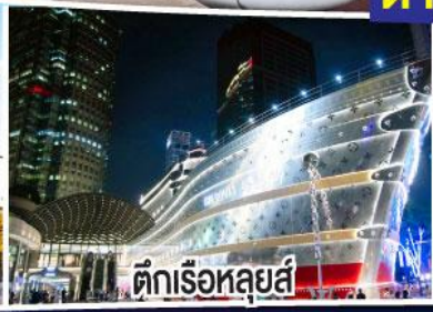
ตึกเรือหลุยส์