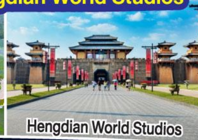
Hengdian World Studios