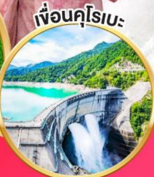
เพื่อนคูโรเบะ