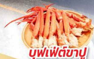
บุฟเฟ่ต์ซาซิมิ

ชมความงามของกำแพงหิมะ เส้นทางสายอัลไพน์ ทาเคยาม่า ฟูจิ ซิบะ ซากุระ เฟสติวล (Pinkmoss)