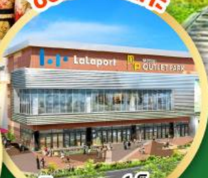
มีคชยุ เอทท์เล็ก พาร์ค คาโดมะ