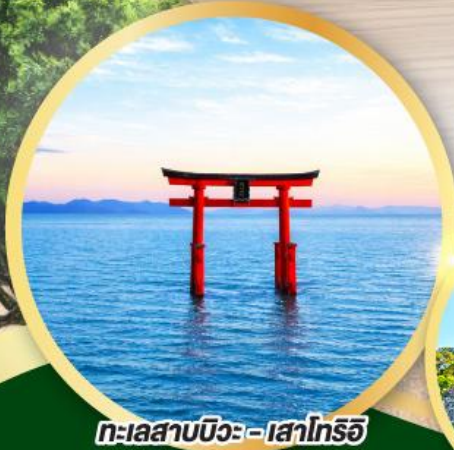
ทะเลสาบบิวะ - เสาโทริอิ