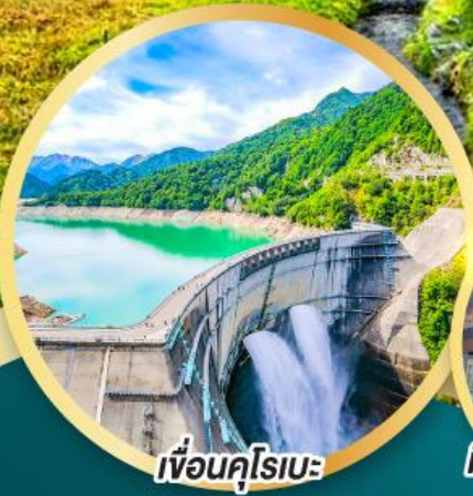
เพื่อนคู่ใจ: