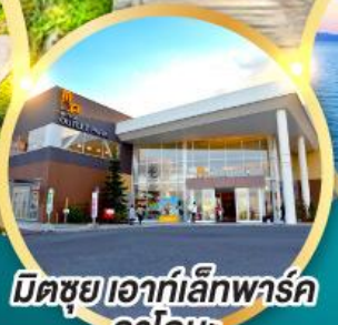
มิตรชย เอากีลีกพาร์ค คาโดมะ