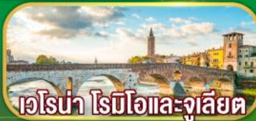
เวโรน่า โรมิโอและจูเลียต