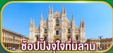
ซ็อบบิงจู่ใจที่มีลาน