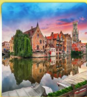
บรุคเกิ้ล