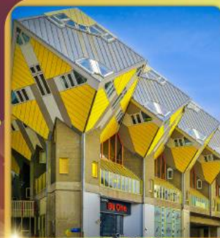
บ้านลูกเต่า โค้คคูบัส

“ล่องเรือหลังคากระจก” ชมกรุงอัมสเตอร์ดัม