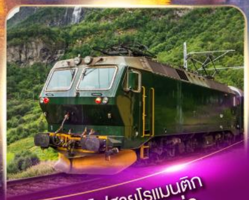
รถไฟสายโรแมนติก ฟลิมส์บาน่า