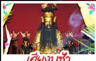
เอียงบูซิว