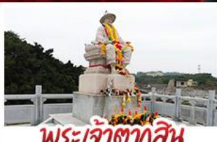
พระเจ้าตากสิน