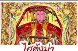
ไต้ตังมา

มรดกโลกบ้านดินตุ๋นไหลเวียนไหลเต็ง - สะพานเซียงจิว ไต้ตังมา (เจ้าแม่กบตัม) - เอียงบูซิว (เจ้าพ่อเสือ) พระเจ้าตากสินมหาราช - อวนน้ำแร่จากธรรมชาติ ไม่ลงร้านซ้อป - พักโรงแรม 4 ดาว เมนูพิเศษ!!! อาหารแต้จิ๋ว 18 อย่าง, สุกีชีฟู้ด ผ่านพะไลต้นตำรับแต้จิ๋ว