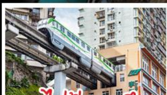
รถไฟฟ้าทะเลลู่ตีก