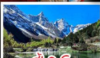
ปี้ผิงโข้ว