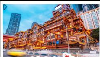
แดงเฉยตัง