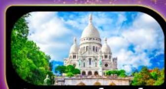
วิหารสกรเทอร์ มงมาร์ต