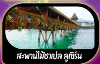
สะพานไม้ชาเปล คูชีริน