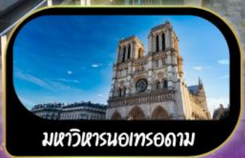
มหาวิหารนอทรอดาม