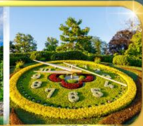
นาฬิกาดอกไม้เมืองเจนีวา