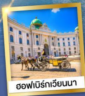
ฮอฟเบิร์กเวียนนา

เข้าชมความงดงามภายใน ของปราสาทนอยชวานสไตน์