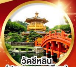
วัดซีหลิน (สวนหนานเท่หลิน)