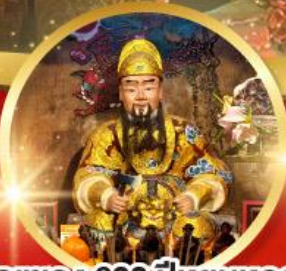
วัดเซกง 600 ปี หุ่นหลวง