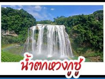
น้ำตกแขวงกู่

สะพานหุบเขาฮวาเจียง สะพานแขวนที่ยาวที่สุดในโลก ปราสาทจืหลงเปา - หมู่บ้านแม้วเจียงจ้าย กุยหยางชมทุ่งดอกไม้สตาร์ดและดอกซากุระ ล่องเรือทะเลสาบหวันเฟิงหู - น้ำตกหวงกู่ พักโรงแรมระดับ 4 ดาว - ชมหอเจียซิวไหลว เมนูปลาต้มซูปเปรี้ยว - ไม่ลงร้านซื้อ