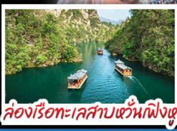
ล่องเรือทะเลสาบหวันเฟิงหู